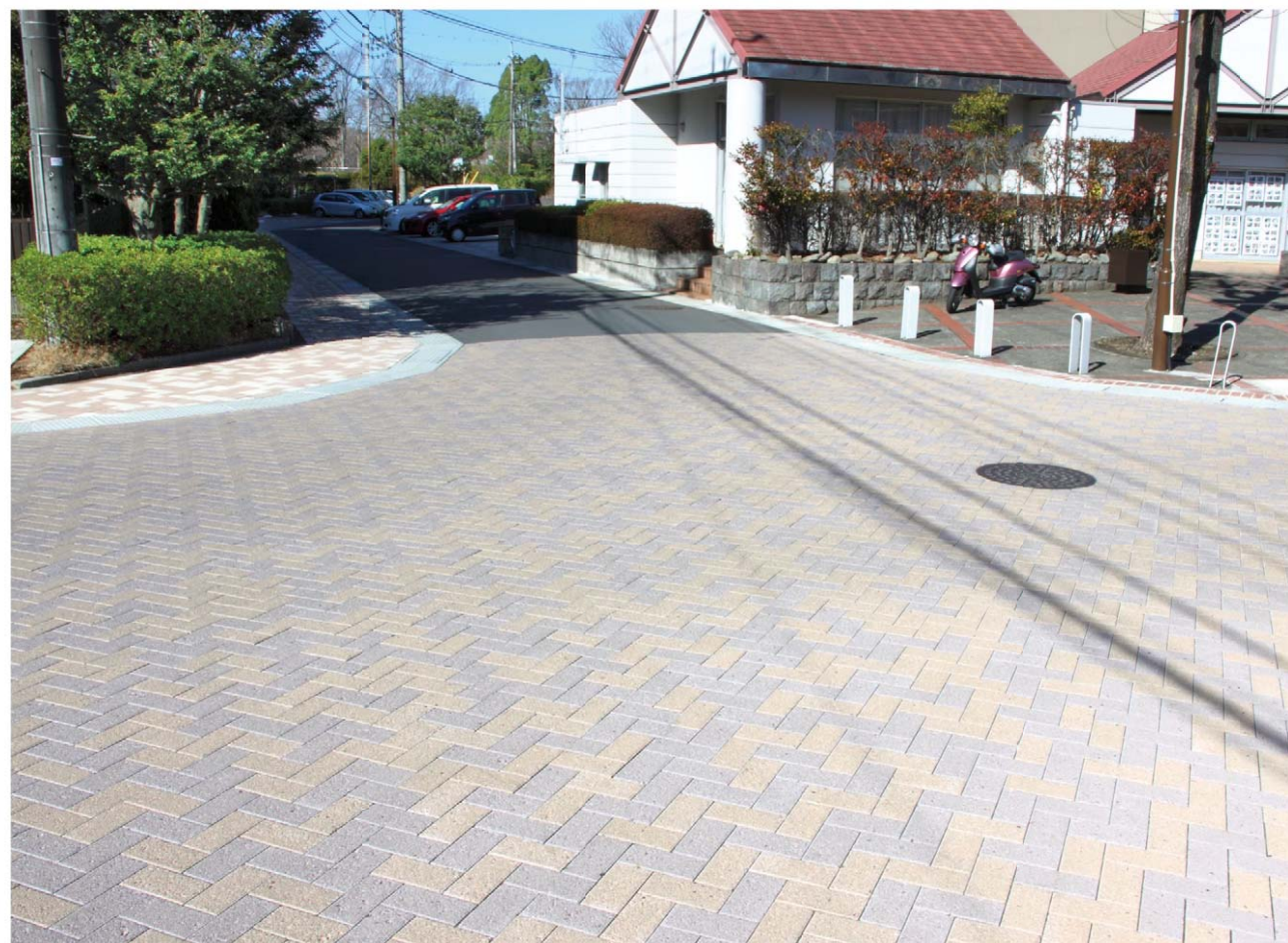
ホームタウン南大沢車道：東京の西部、多摩丘陵に位置する住宅地「ホームタウン南大沢」の車道部分に採用されたミマーレ Aシリーズ。 クラシカルなディテールが落ち着いた街並みに馴染んでいます。